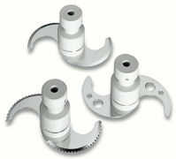
Lama per impasti