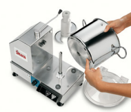
Vasca inox 18/10 con fondo termodiffusore facile da svuotare e da pulire