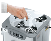
Vano per piastre e coltelli